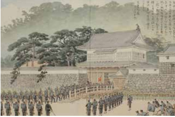
明治天皇御紀附図稿本「中国西国巡幸鹿児島着御」(宮内庁宮内公文書館蔵)

明治5年(1872)5月23日～7月12日、明治天皇は近畿・中国・九州・四国を巡幸。参議西郷隆盛以下約70名が供奉・随行し、鹿児島には6月22日から7月2日まで滞在。神代三陵を遙拝され、県庁など各地の視察、海陸対抗操練の天覧、市民による踊りの観覧などが行われた。