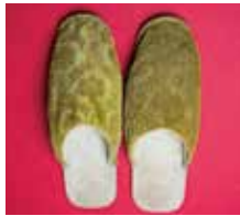
明治天皇遺品「御箸」「扇子」「室内履き」