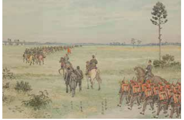
明治天皇御紀附図稿本「習志野原演習行幸」

明治6年(1873)4月29日、明治天皇は下総国千葉郡大和田村へ行幸、30日には篠原国幹を指揮長官として近衛兵による天覧演習が行われた。5月13日、天皇より勅諭をもって、この地(旧徳川幕府の軍馬育成の放牧地)に「習志野ノ原」の名を賜り、これが「習志野」の地名の発祥とされている。