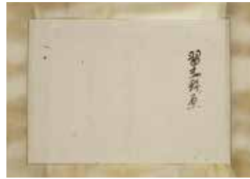
明治天皇御宸筆「習志野ノ原」 (宮内庁宮内公文書館蔵)