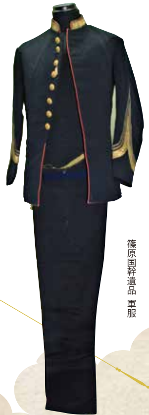
篠原国幹遺品軍服