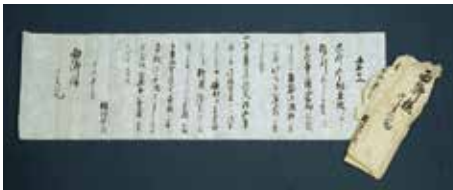
「西郷隆盛宛板垣与三次書翰」複製 (原資料個人蔵)