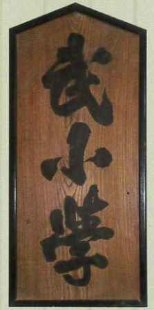
鹿児島市立西田小学校所蔵(複製)