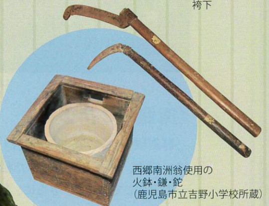
西郷南洲翁使用の 火鉢・鎌・鉞 (鹿児島市立吉野小学校所蔵)