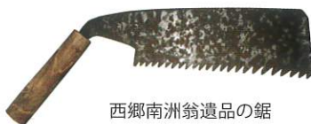
西郷南洲翁遺品の鋸