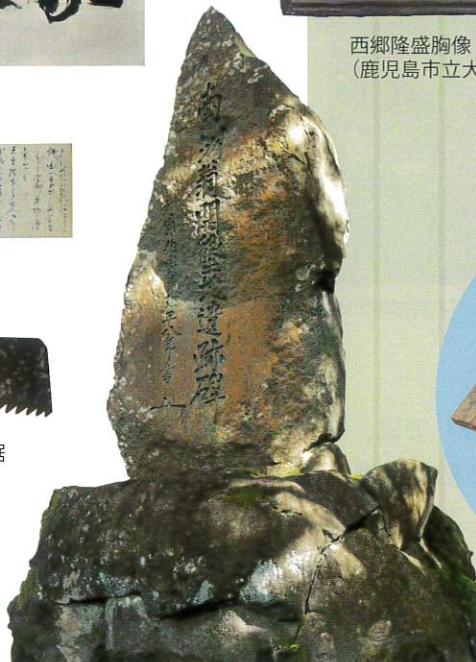
南洲翁開塾地遺跡碑